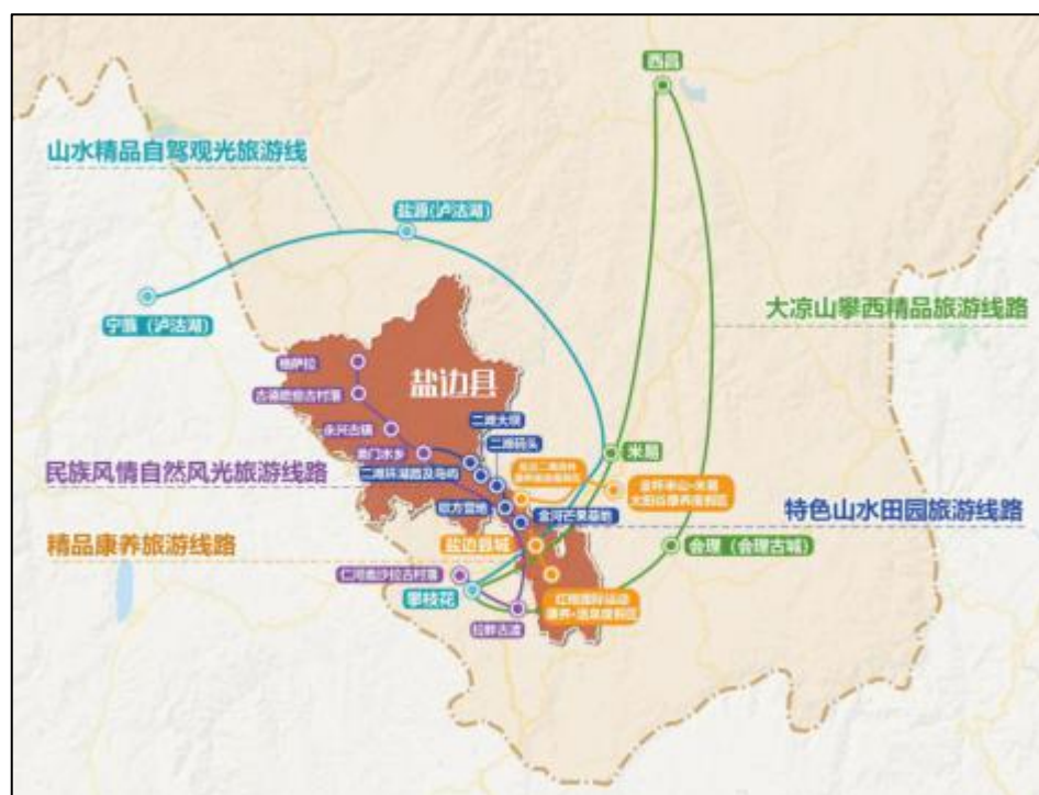
图3 市际联动旅游线路规划图