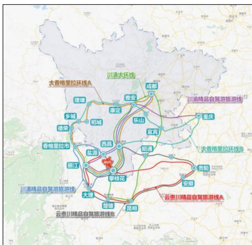
图 1 省际联动旅游线路规划图